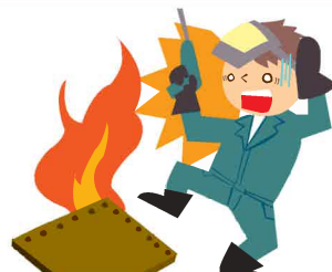
火災・爆発・破裂によって生じた損害