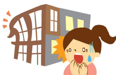
設計、施工、材質または製作の欠陥によって生じた損害（注）

（注）設計、施工、材質または製作の欠陥により崩壊・倒壊・破損等の不測かつ突発的な事故による損害が生じた場合のみ保険金をお支払いします。欠陥そのものを除去するための費用に対しては保険金をお支払いしません。