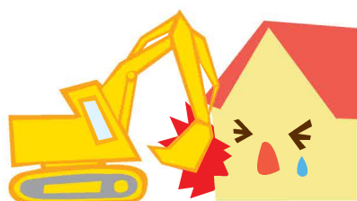
労働者、従業員の取扱上の過失または第三者の悪意によって生じた損害