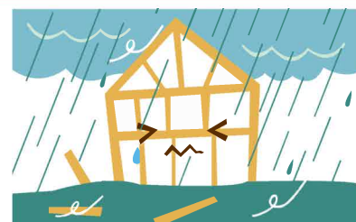
台風・高潮・豪雨・洪水によって生じた損害